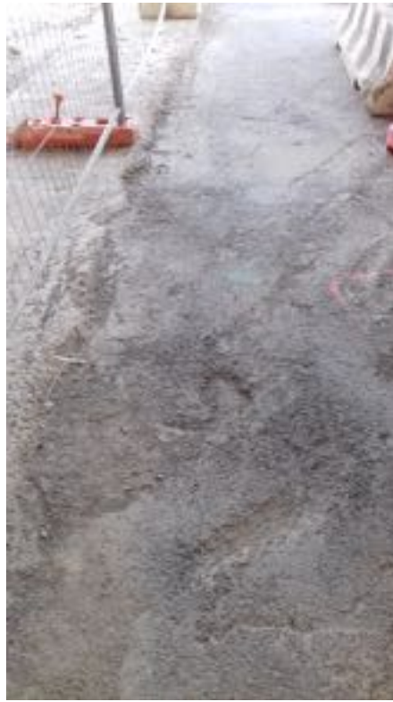
FOTO 2 IL FONDO IN CASO DI PIOGGIA VIA AURELIA