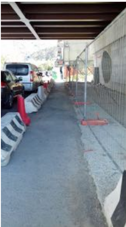
FOTO 1 IL FONDO DISSESTATO