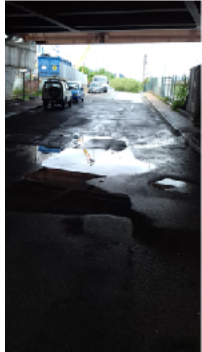
FOTO 3 INSUFFICIENTE DECORO URBANO CANTIERE LATO MONTE